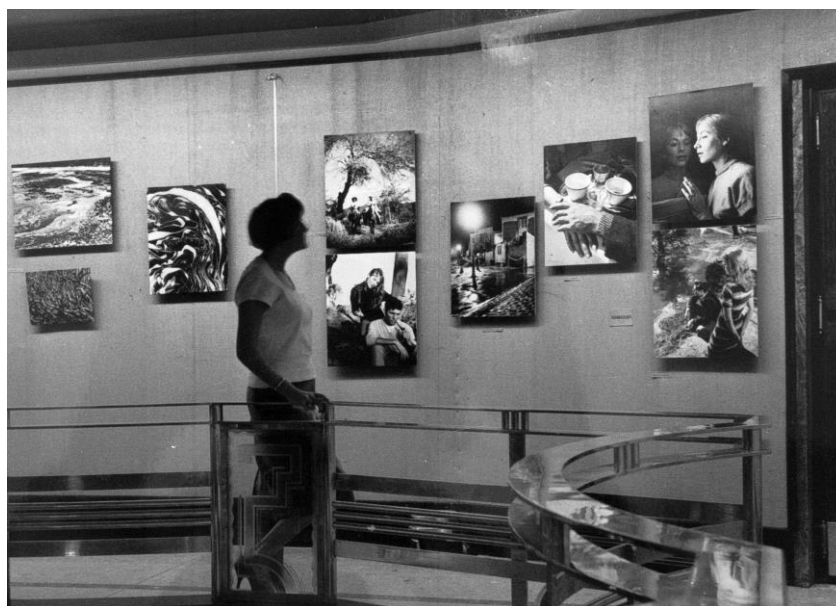
Exposición del grupo La Carpeta de los Diez , Teatro Ópera, Buenos Aires, 1959.